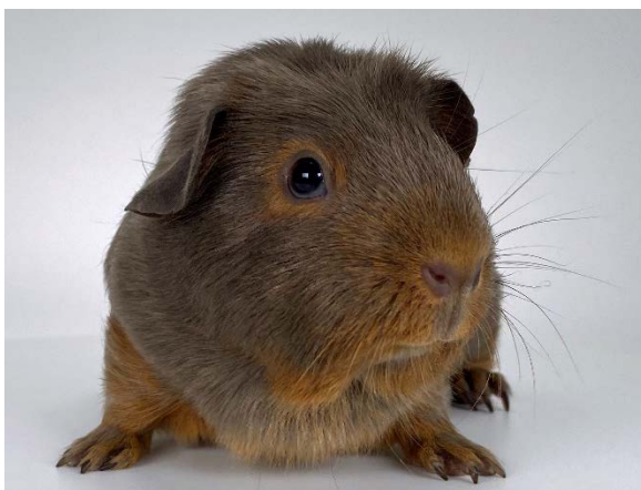
mit 15 Wochen

Man kann sehr gut erkennen, wie die Loh-Zeichnung im Laufe der Wochen zunimmt und mehr Kontrast entwickelt.