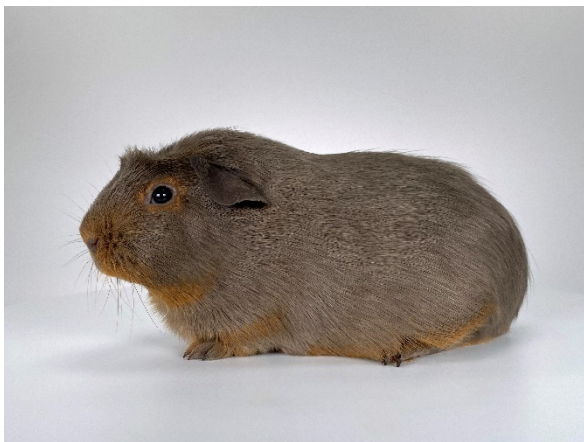
mit 15 Wochen

Man kann sehr gut erkennen, wie die Loh-Zeichnung im Laufe der Wochen zunimmt und mehr Kontrast entwickelt.