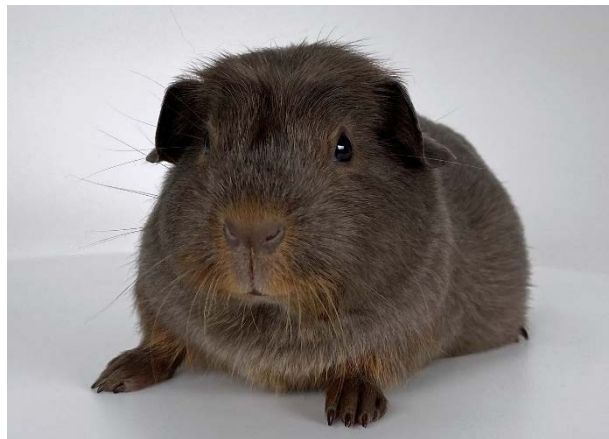
mit 10 Wochen